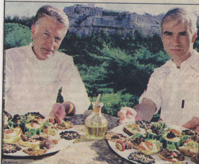
Les mouliniers mettent les petits plats dans les grands